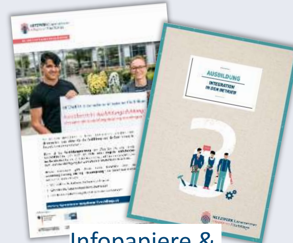
Infopapiere & Broschüren