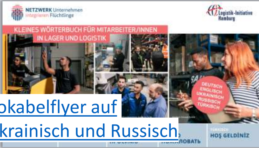
Vokabelflyer auf Ukrainisch und Russisch