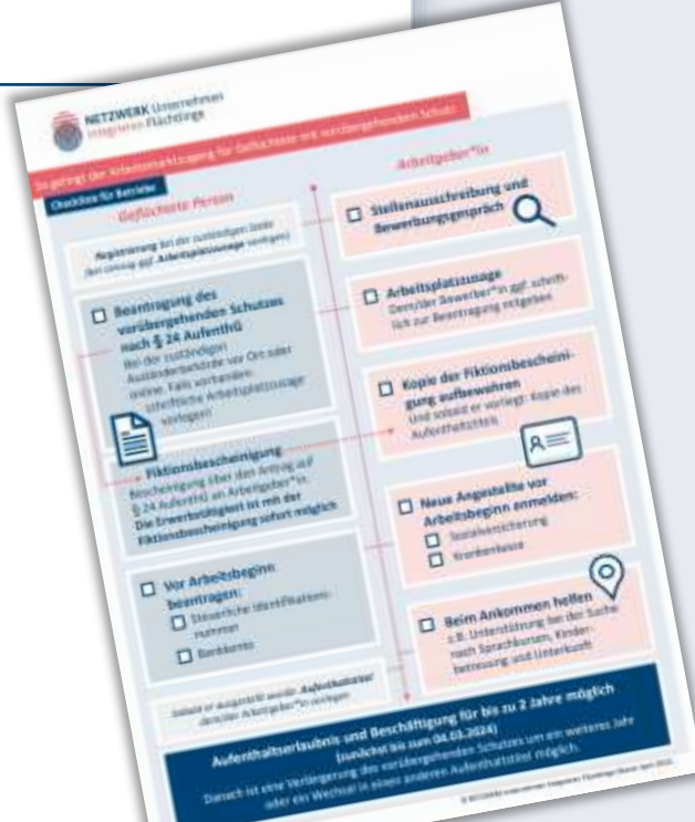
Checkliste für Betriebe