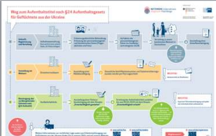
Der Weg zum Aufenthaltstitel