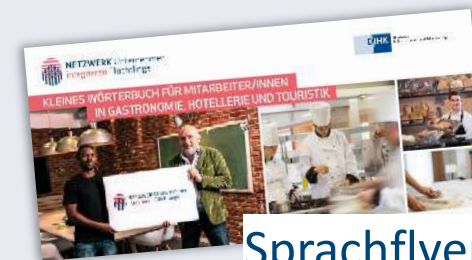
Sprachflyer + -poster